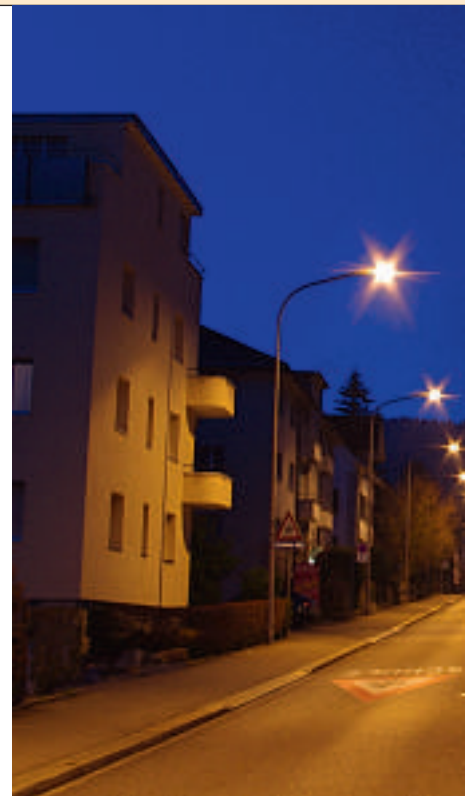
Das EWZ ersetzt jedes Jahr 700 bis 800 veraltete Lampen