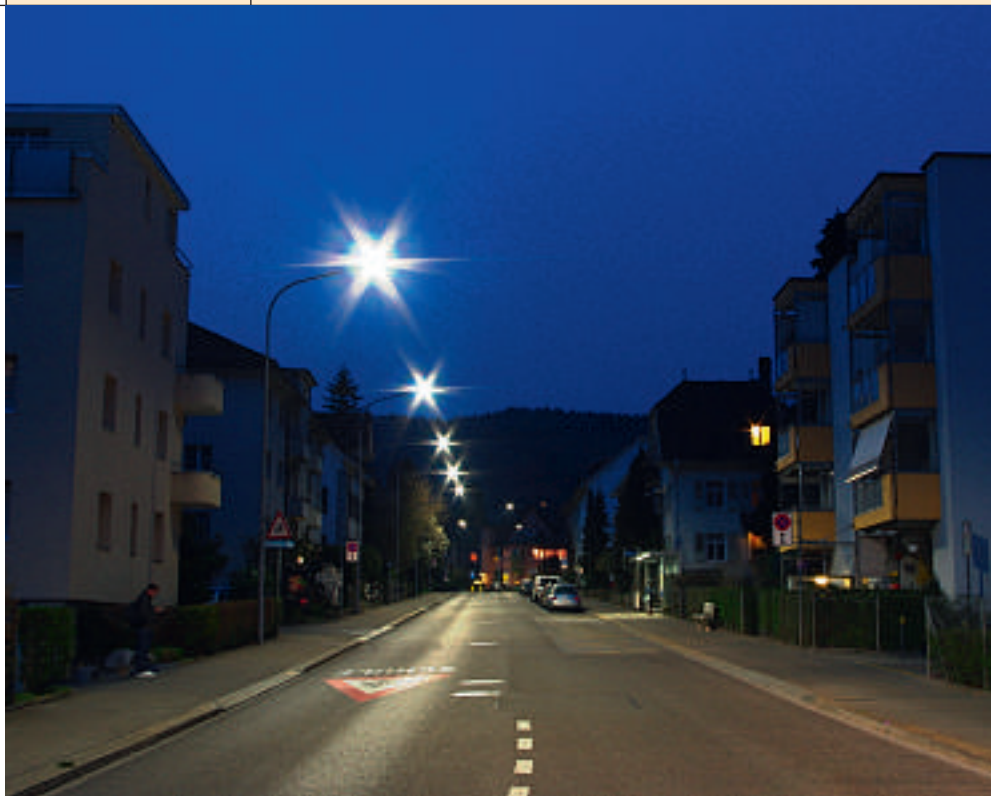
LED-Leuchten brauchen nur noch 30 Watt pro Jahr, während es bei den alten Quecksilberdampflampen 80 Watt waren