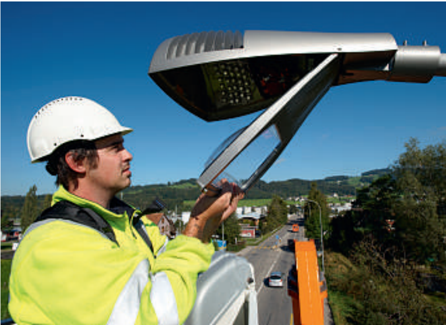
Regelmässige Kontrolle, Reinigung und Wartung der Lichtpunkte ist unverzichtbar