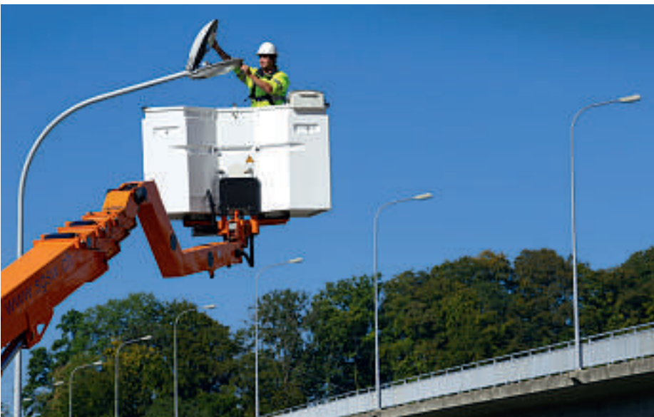
Allein auf Zürcher Stadtgebiet stehen 42 000 Strassenleuchten

Schweizerischen Agentur für Energieeffizienz (SAFE) zum Stromverbrauch der Strassenbeleuchtung in den Kantonshauptstädten landete Zürich 2006 auf dem drittletzten Platz. Die effizienteste Beleuchtung hatte St. Gallen. Dort genügten 8 MWh (Megawattstunden), um einen Kilometer Strasse ein Jahr lang zu beleuchten – Zürich brauchte dafür 30 MWh. 2008 hiessen die Zürcher mit grossem Mehr den Einstieg in die 2000-Watt-Gesellschaft gut. Heute ersetzt das EWZ sukzessive jedes Jahr