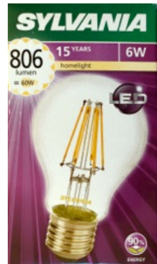
Sylvania, LED Homelight 6 Watt, 806 Lumen