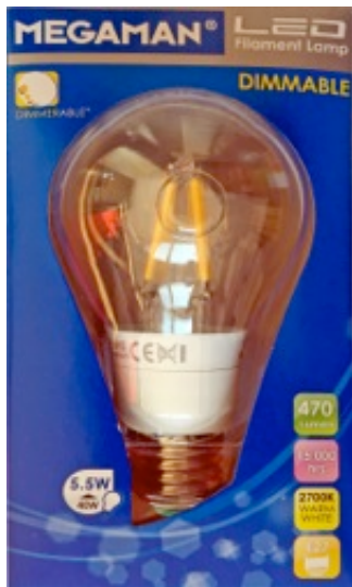
Megaman, LED Filament Lamp 5.5 Watt, 470 Lumen, dimmbar