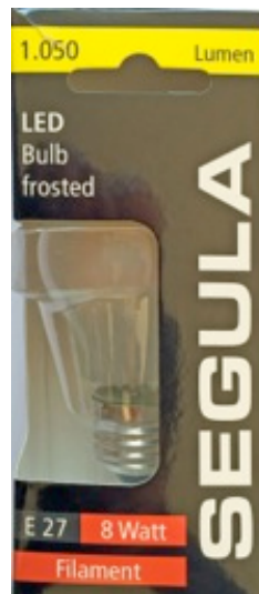
Segula, Filament LED Bulb 8 Watt, 1050 Lumen