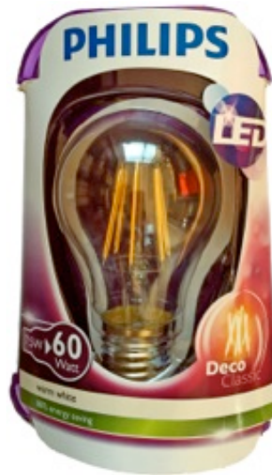
Philips, LED Deco Classic 7.5 Watt, 806 Lumen