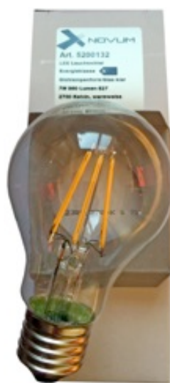
Xnovum, LCC Lamp 6.5 Watt, 960 Lumen