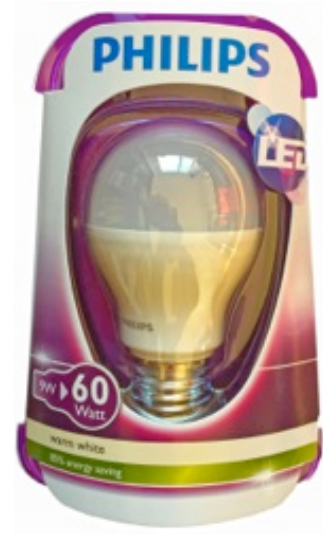
Philips, LED Standard 9.5 Watt, 806 Lumen