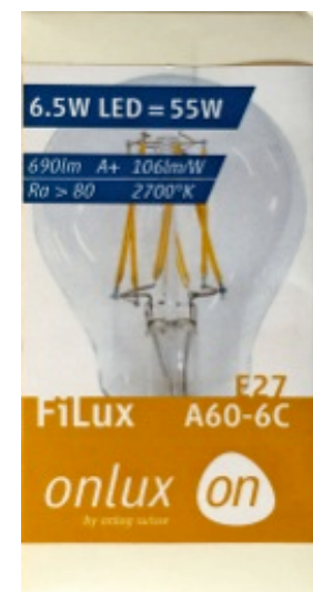
Onlux, LED Filux 6.5 Watt, 690 Lumen