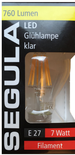
Segula, LED Glühlampe 7 Watt, 760 Lumen