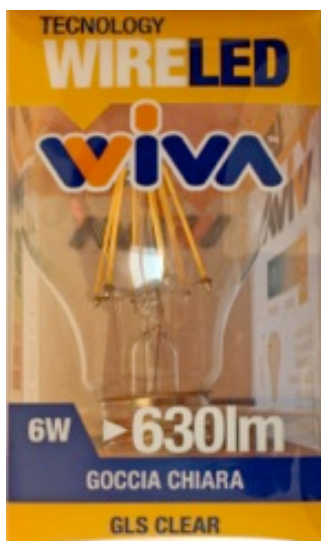
Viva, Wire LED 6 Watt, 630 Lumen