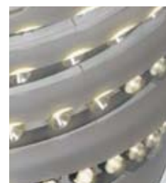
Immagini dall'alto al basso: Modulo LED, LED con ottica, applicazione LED