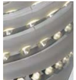
Bilder von oben nach unten: LED-Baustein, LED mit Optik und Linsen, LED-Applikation