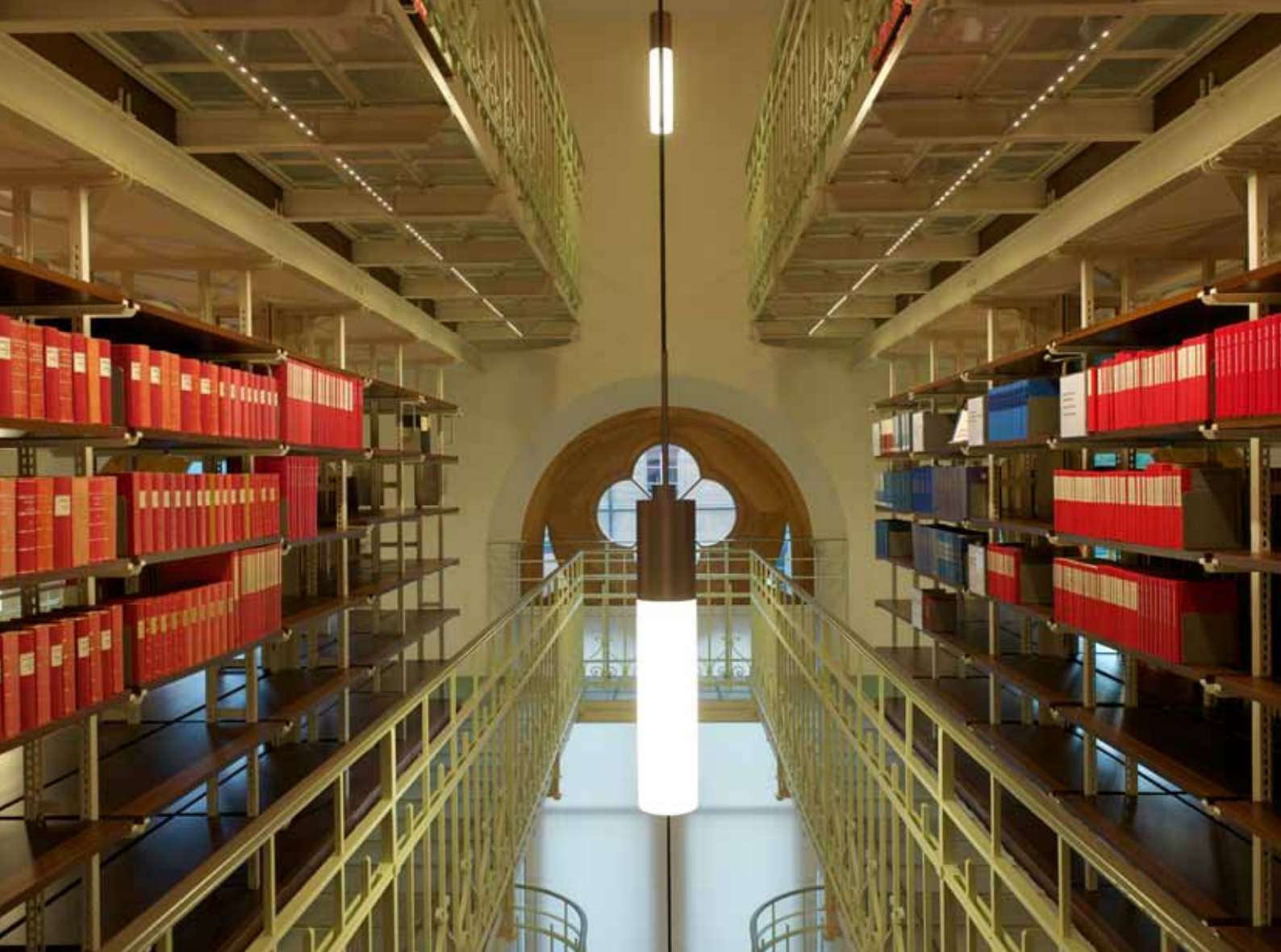
Die Parlamentsbibliothek in Bern (Rudolf Steiner)